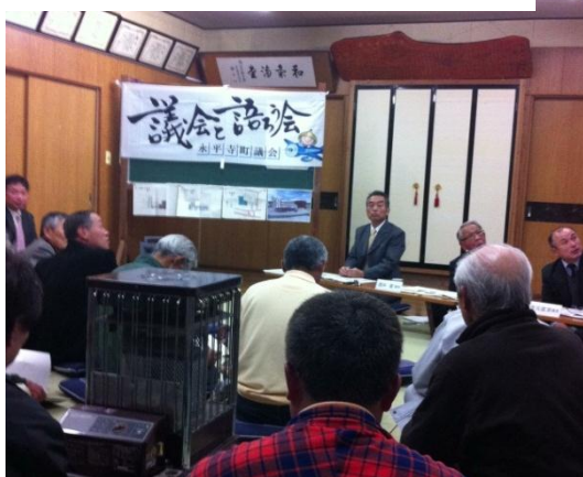
住民の方からも活発な意見が飛び交っていました。

議会広報、ホームページ、SNS 活用や各地域を廻りながらの意見交換会「議会と語ろう会」など斬新で挑戦的な議会改革を進めています。