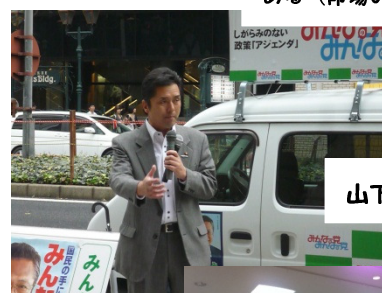
山下議員街頭活動