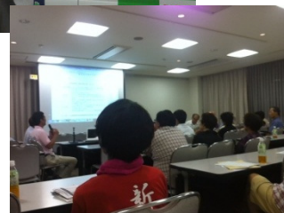
前回の報告会風景です！