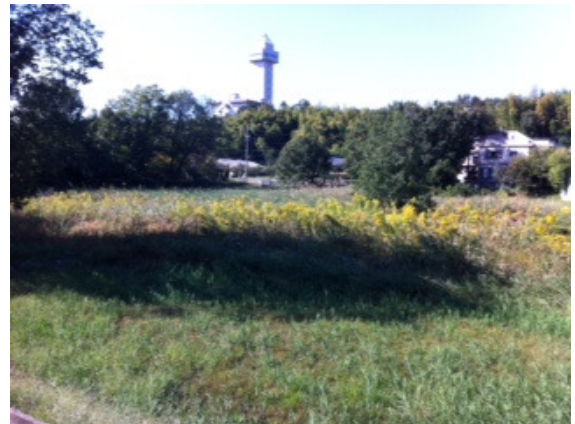
農業用水としての使命はなく、雨水調整機能だけの活用

③農業用水としての活用を終えた山の田池では、有志の方々に支えられ一定の保全はされていますが、まったく将来ビジョンが示されていません。1ヘクタールという土地管理の意味合いも含め、有効活用を探りながら将来への展望を示すべきと考えます。