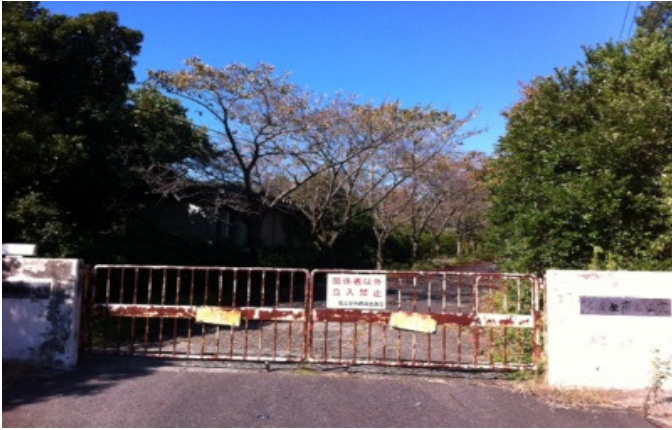
追加で購入する若松寮跡地（7ヘクタール）

平成 24 年 9 月 3 日より 27 日の 25 日間の日程で開会されました。補正予算案や平子町地内の名古屋市立保育短大跡地購入契約案件などが審議され、可決されています。会派としましては、教育委員会委員の選任同意案に対し、職種的な枠の中での選定に形骸化を感じ、質疑の中で指摘した上で賛同しませんでした。教育委員に